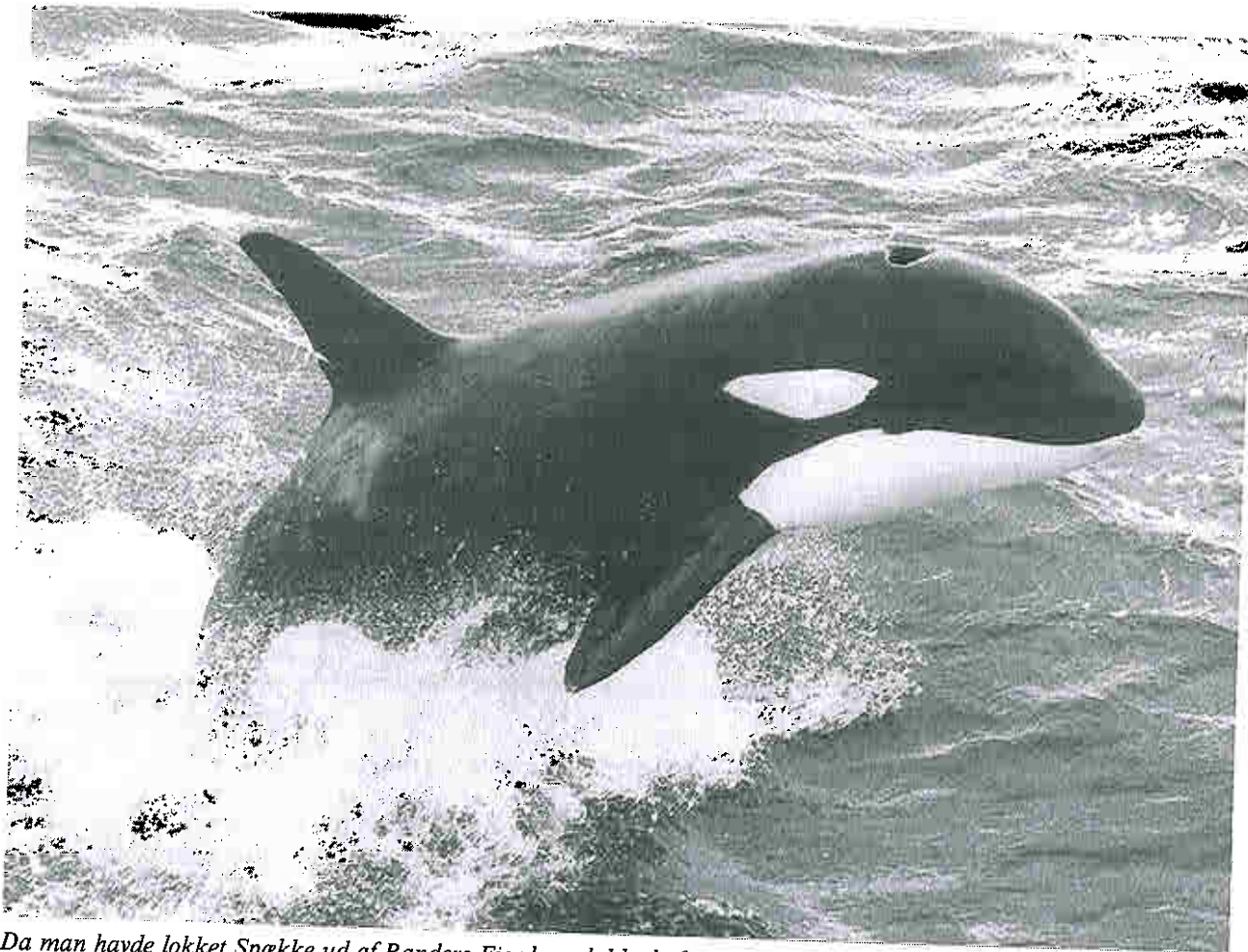
Da man havde lokket Spække ud af Randers Fjord og slukkede for »sprøjtebadet«, sprang den flere gange helt ud af vandet.

re ud i fjorden, men om det var for at fange fisk er svært at bedømme. Erfaringer fra hvalarier viser, at hvis en spækhuggers rygfinne hænger slapt til en af siderne, er det tegn på, at den ikke er helt på toppen. Men Spække så godt ud og virkede jo ikke stresset. Den havde et par ar på kroppen og et karakteristisk hak i rygfinnen, men ingen af dem syntes alvorlige. Så vidt vi kunne skønne, havde den det altså udmærket.